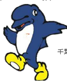
千葉県警察シンボルマスコット「シーポック」