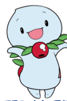
マスコットキャラクター 「ほのびー」