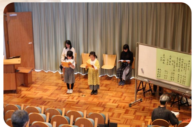
子どもたちの朗読発表会 ♪