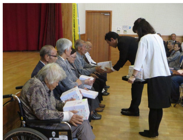
敬老会で90歳到達者に記念品を贈呈