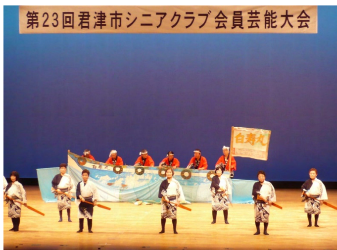
君津市シニアクラブ会員芸能大会