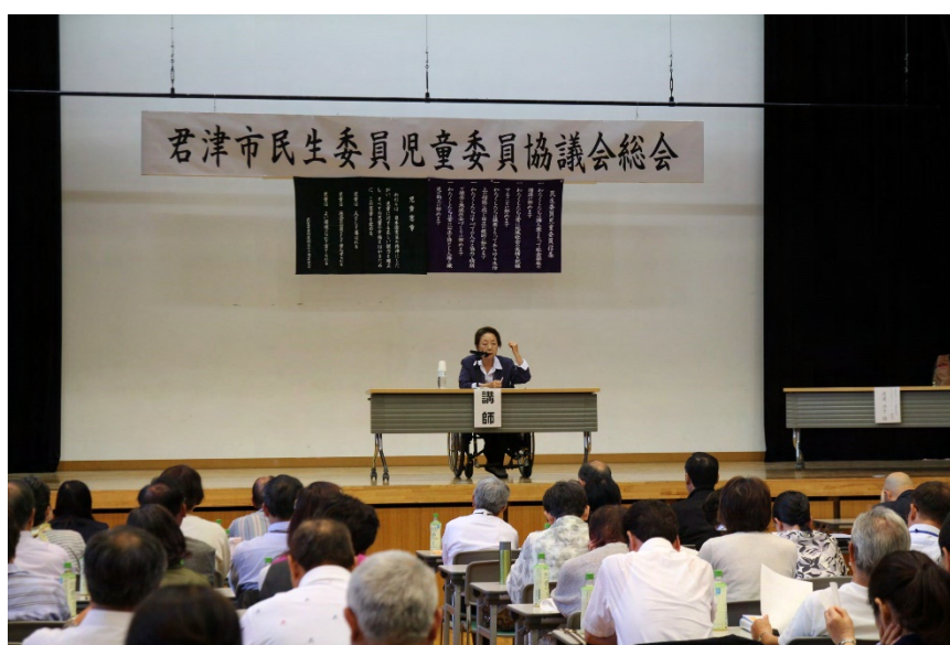
君津市民生委員児童委員協議会総会での研修会