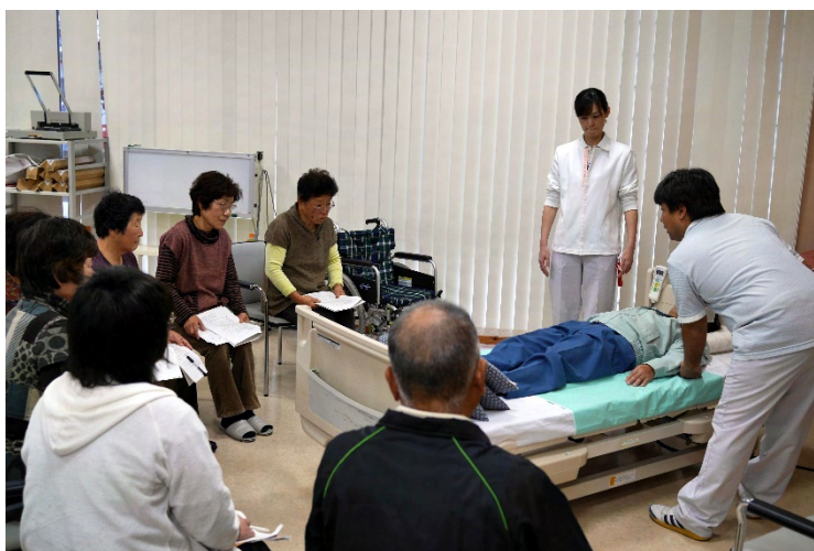
特別養護老人ホーム上総園での介護教室