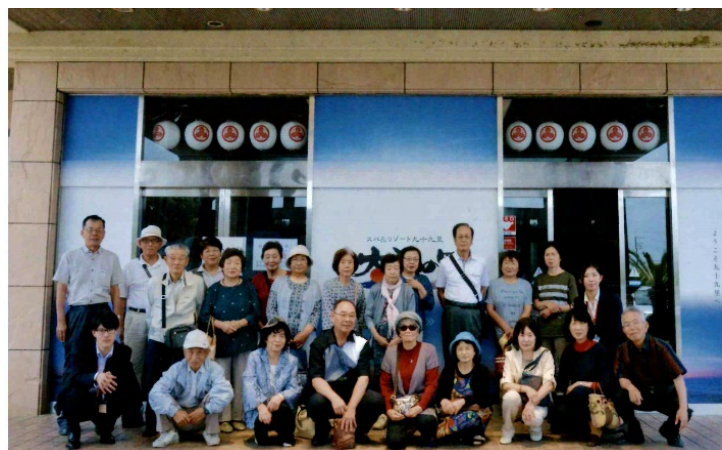
ふれあい見学会の参加者で記念写真