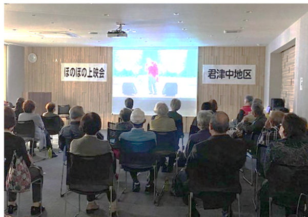
ほのぼの上映会でゆったり楽しいひと時