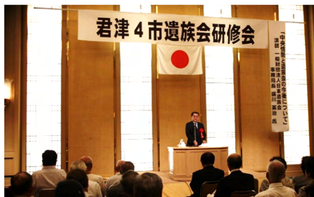
君津4市遺族会研修会