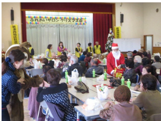
クリスマス会で交流