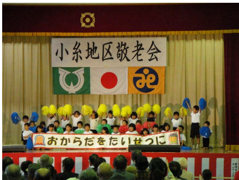
地域のみんなで長寿を祝う敬老会