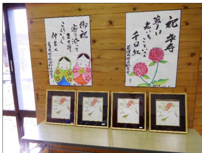
役員手作りの敬老記念品