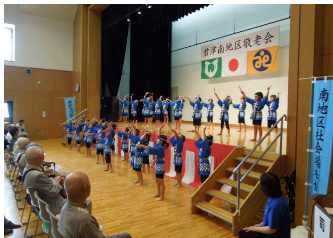
保育園児による敬老会でのアトラクション