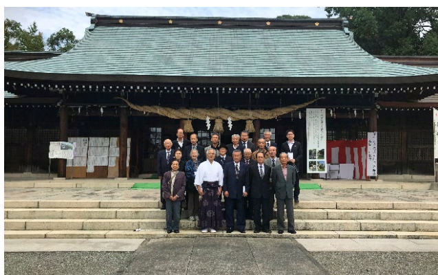
慰靈巡拝旅行 (熊本県護國神社)