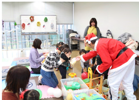
子育てサロンクリスマス会