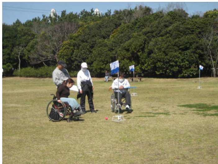
グラウンド・ゴルフ大会