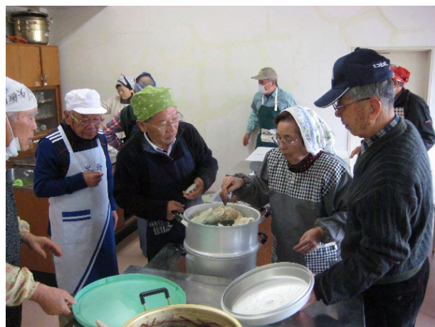
地域の女性が先生となって実施している 男の料理教室