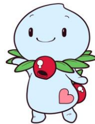
マスコットキャラクター ほのぴー