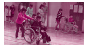
車いすを使った福祉体験学習