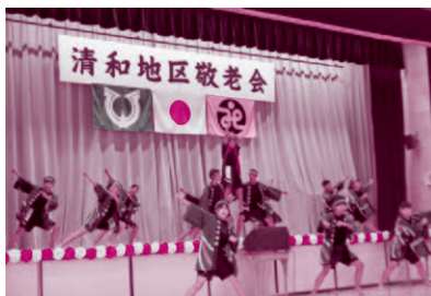
清和中学校生徒によるソーラン節