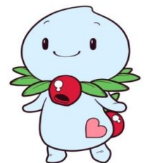
君津市社会福祉協議会 マスコットキャラクター ほのびー

所在地 君津市久保3丁目1番1号 君津市保健福祉センター(ふれあい館)3階 電話番号 0439(55)0444 (直通) FAX番号 0439(27)1155